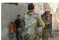
Bimbo palestinese lancia pietre, militari israeliani lo arrestano