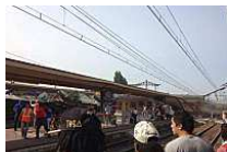
Incidente treno vicino Parigi, convoglio deraglia, 8 morti