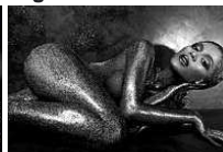
Beyoncé' nuda e tutta d'oro per 'Flaunt'