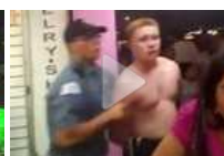
Google Glass riprende arresto in diretta