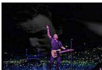
"Intramontabile" Springsteen, a 64 anni scatenata l'arena di Rock in Roma