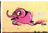
Street art: il Gazometro diventa 'esposizione permanente'