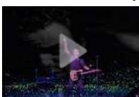
Bruce Springsteen fa cantare un bambino e manda Roma in estasi